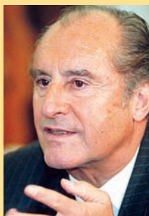
Thomas Klestil Rakouská republika exprezident