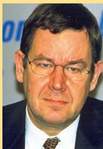
Poul Nyrup Rasmussen Dánské království premiér