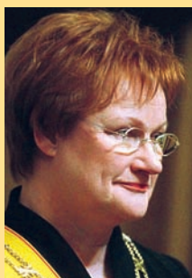
Tarja Halonen Finská republika prezidentka