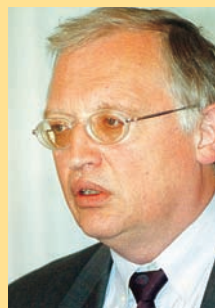
Günter Verheuten komisař Evropské komise pro rozšíření