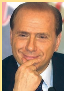
Silvio Berlusconi Italská republika premiér