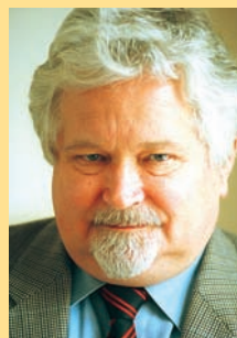
Petr Pithart Česká republika předseda Senátu