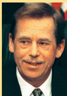
Václav Havel Česká republika exprezident