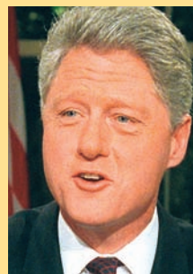
William Clinton Spojené státy Americké exprezident