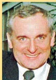
Ahern Bertie Irská republika premiér