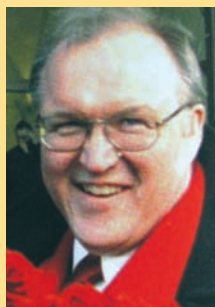
Göran Persson Švédské království premiér