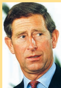
princ Charles Spojené království Velké Británie a Severního Irska