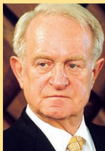
Johannes Rau Spolková republika Německo exprezident